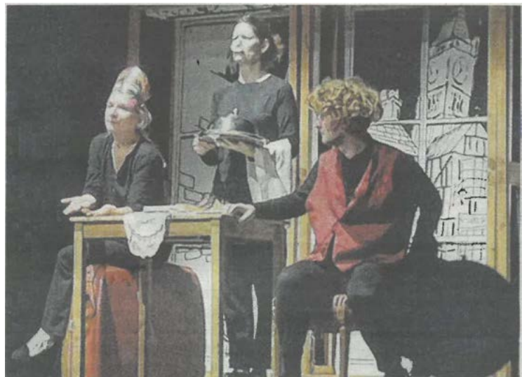
Les trois comédiens, à l'humour désopilant, ont servi l'un des chefs-d'œuvre de Dickens.

« Au XIX e siècle, qu'est-ce qui remplaçait Netflix ? », ironise Hélène Géhin, comédienne et conceptrice de la pièce. « Le livre, bien sûr ! ». Saison 1 : voici donc l'histoire de Pip, jeune orphelin du sud de l'Angleterre, vivant chez sa sœur, sans tendresse. Convié chez une lady, à venir jouer avec Estella, petite fille de bonne famille, il finit par se faire traiter de manant. Plus tard, la fortune aurait pu lui sourire (un héritage confisqué par la couronne...). Saison 2 : à 23 ans, il n'a toujours pas d'argument pour séduire Estella, dont il est fou amoureux. Pourtant, après avoir reçu une éducation à Londres, il touche enfin le cœur de la belle adoucie par les vicissitudes de la vie. De quoi faire pleurer dans les chaumières en pleine époque victorienne. Certes. Aujourd'hui,