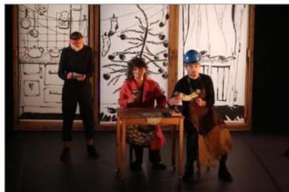
Le festival a programmé « Les Grandes espérances » ce mercredi à Kingersheim.

Le récit est truffé de multiples clins d'œil et références culturelles en petites touches facétieuses, sans ja-